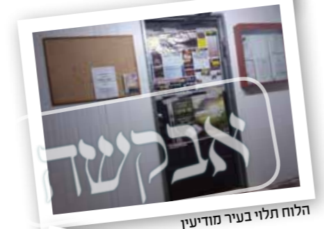
הלוח תלוי בעיר חצור