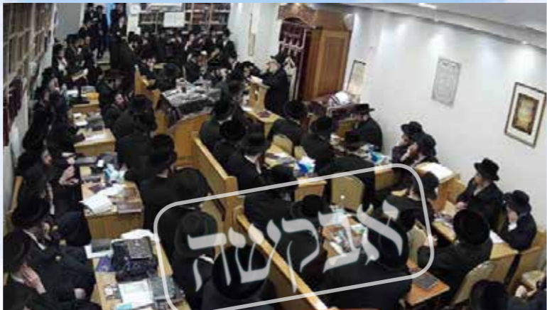
אצלנו יש עצרת כל יום. העצרת בביהמ"ד של אנ"ש בלונדון

כן הזכיר את דברי מוהרנ"ת שישנם שלושה מניעות שלא שייך לשברם בדרך הטבע, י"ם 'בית-האסורים' ומלחמה, והעצה היחידה לעומתם הוא להגביר הרצון וההשתוקקות ועי"ז יזכו בוודאי לשבר את כל המניעות הפרטיים והכלליים.