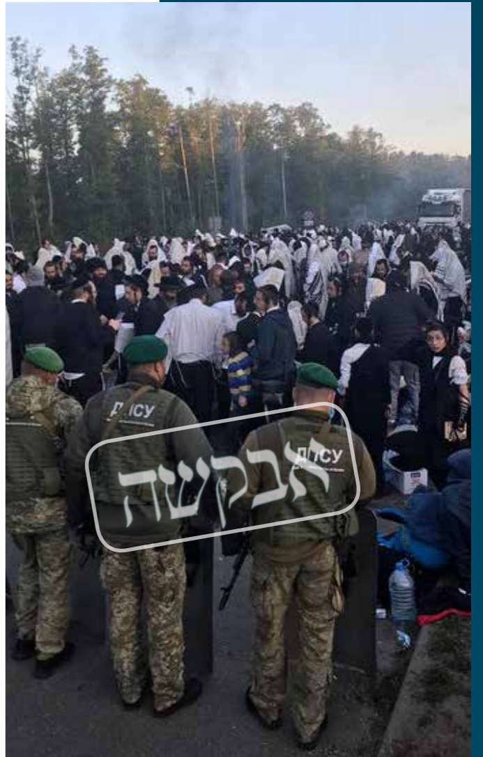
צריך אך ורק לצעוק לה. אניש' בגבול בלארוס בשנת תש"פ

הכל שווה בכדי לקבל רווח וזדאי ומוחלט, רווח אמזי ונצחי! שהרי כל אלו הנוסעים לצורך ממון נוסעים על הספק, ואילו אנו נוסעים לרבינו שהוא זודאי, והוא מוציא אותנו מכל קליפת עמל"ק בגימ' ספ"ק