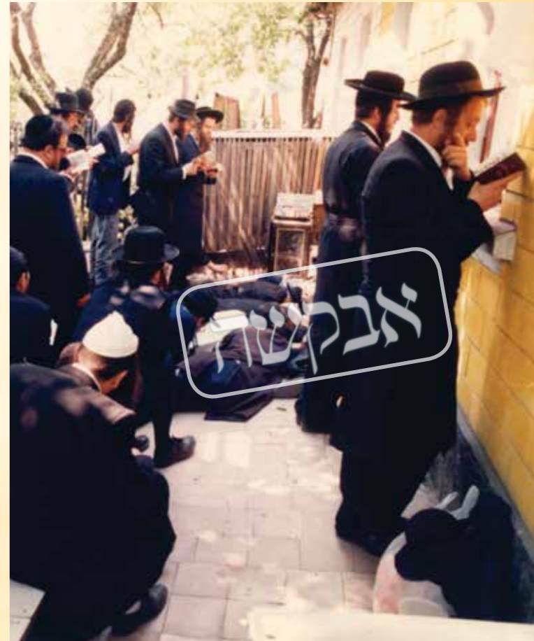
אנ"ש ידעו תמיד שהם נוסעים למקום ללא שום גשמיות. הקיבוץ באומן תש"ן

אמנם, אם נחזור מעט יותר אחורה, אף לאחר שנות השלטון הקומוניסטי שהיה במלא עוזו, בתקופה של לפני פחות משלושים שנה, הרי שהעניינים התנהלו בצורה אחרת לחלוטין. היה זה דבר פשוט לכל בר דעת שהנסיעה לאומן איננה דבר של מה בכך. איש לא ידע מה ילד יום, וממילא גם אם ה"חלום הנכסף" היה להגיע לאומן בר"ה, אולם ה"חלום המציאותי" יותר היה להגיע עכ"פ פעם אחת