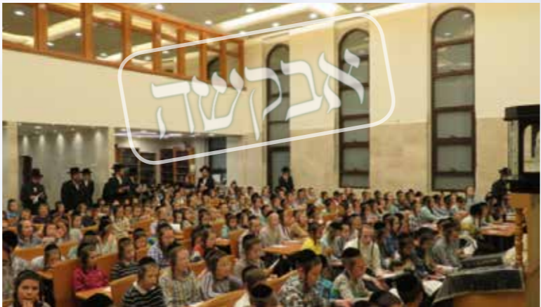
עצרת התפילה לילדים. בית שמש