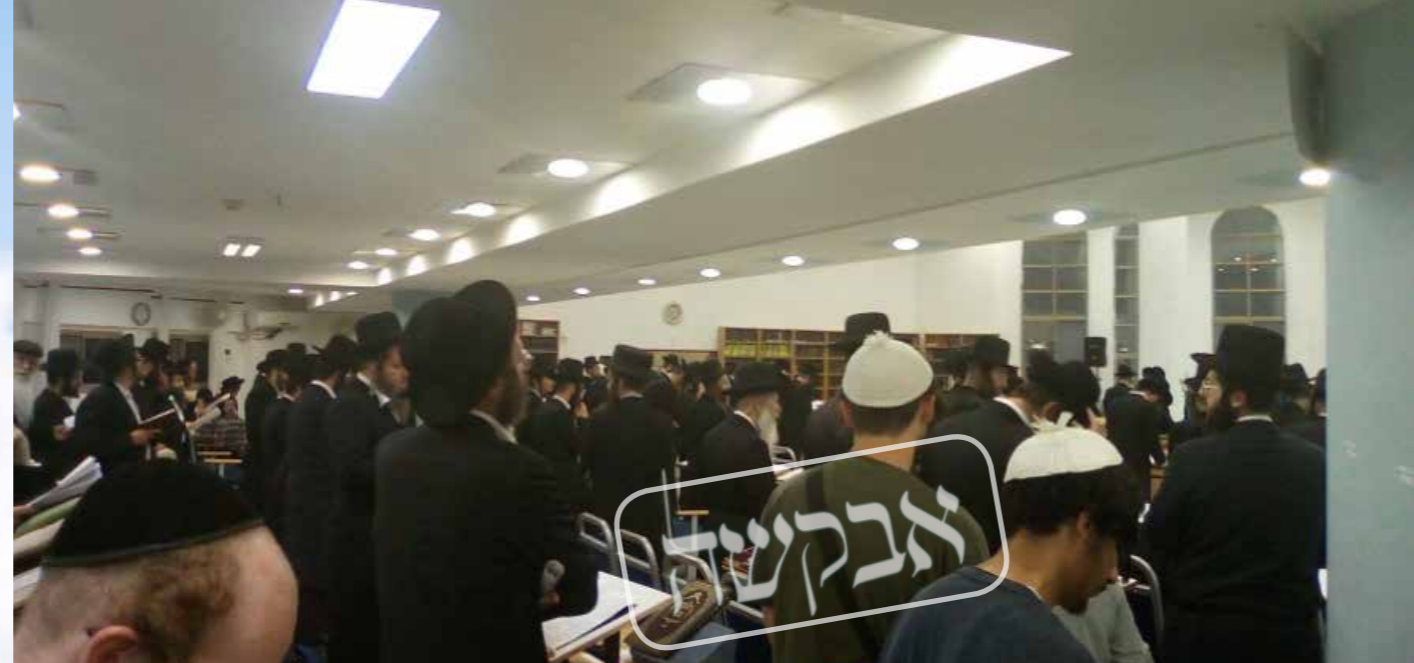
מדובר בעצרת היסטורית כך כולם אמרו. העצרת בעיר צפת

לפניכם סקירה קצרה ומדומית, עם המארגנים או המשתתפים בכמה מעצרות התפילה ברחבי תבל, מהם תוכלו להקיש על הכלל כולו. ניסינו להציע לפניכם את הסגנונות השונים, על אף שלא נוכל להעביר