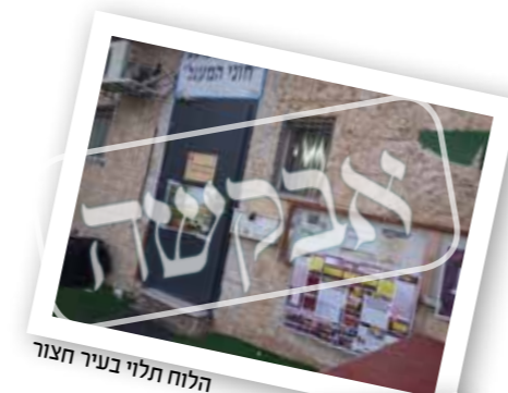
הלוח תלוי בעיר חצור