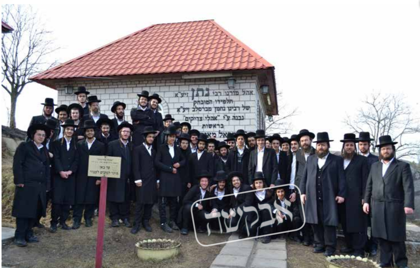
כל יום יש שתי שמחות. בחורי הישיבה עומדים בסמוך לציונו של מוהרנ"ת בניסיעה לקברי צדיקים

מיד לאחר שנזרקנו לרחוב הוצאתי את חסכוני ואמרתי להם; "אל דאגה, רביז"ל אמר מה לכם לדאוג מאחר שאני הולך לפניכם, ולפיכך אני מכריז על פתיחתו של "כולל אברכים" עבור כולנו