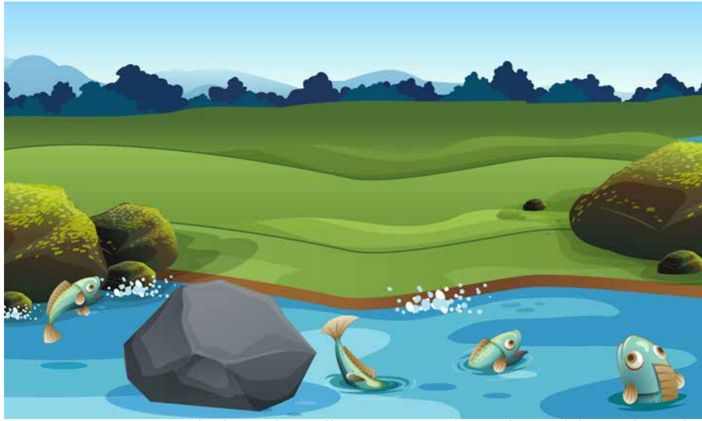
החל יוצא מחוץ לבית המדרש לטיל באויר הזך על שפת הנהר, להתבונן בדגים הפורשים רשת ללכוד הדגים, ולהתענן בהבלי העולם הזה.

העיר חרישווטה הייתה עירה סמוכה לברסלב. בעירה זו התגוררו שני אחים, ששמום הלה לפניהם כבעלי מדות תרומיות בעלי יראת שמים ויגיעים בתורה יומם ולילה.