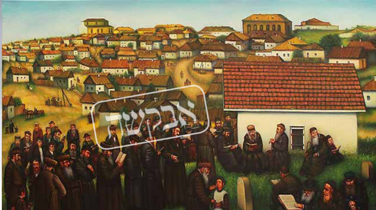
ביותר התגלה עוצם גדולת קדושתו, מעוצם היראה והקדושה שהיה מכניס בכל מי שזכה להתקרב אליו, וכל מי שהיה מדבר עמו בדרך התקרבות, היה נתמלא יראה וקדושה והיה מתלהב מאד מאד להשם יתברך

כמדומני שהייתי זו הפעם הראשונה, מאז ירד מסך הברזל על הציון - כחמישים שנה לפני כן, שכוחו והבטחתו של רבינו למקשה לילד, באו לידי מעשה וכמובן התגלה שליחו של הנס, לא נס. כאמור, אין עמנו יודע עד מה ומה נשתנה נס זה מכל הנסים שליו לא חלה ההסתרה. אמנם הבקי מעט בספרי רבינו, יודע כי רבו מספור התורות בהן מוזכר ומבואר סוד הלידה וקישויה (ליקו"מ כ"א, ל', ב' ח"ב ועוד רבים). בכתיב האר"י (שער הכוונות פסח) מובא