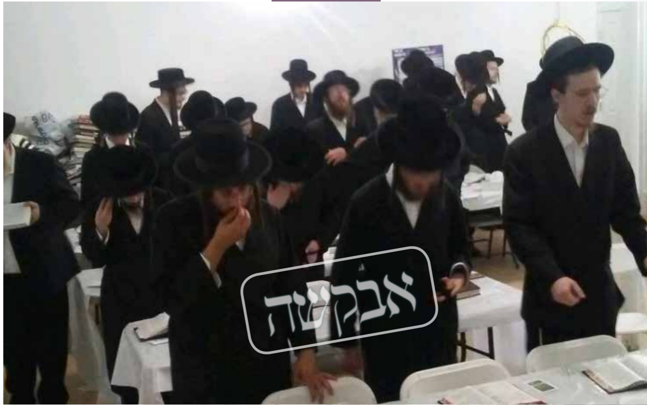
עצרת התפילה סוואן לעיק קנטסקילס ארה"ב

כל אחד הרגיש בבית! כאשר הזכויות נוקפות לגבאי בתי הכנסת היקרים, שהכריזו בליל שבת על חובת ההשתתפות,