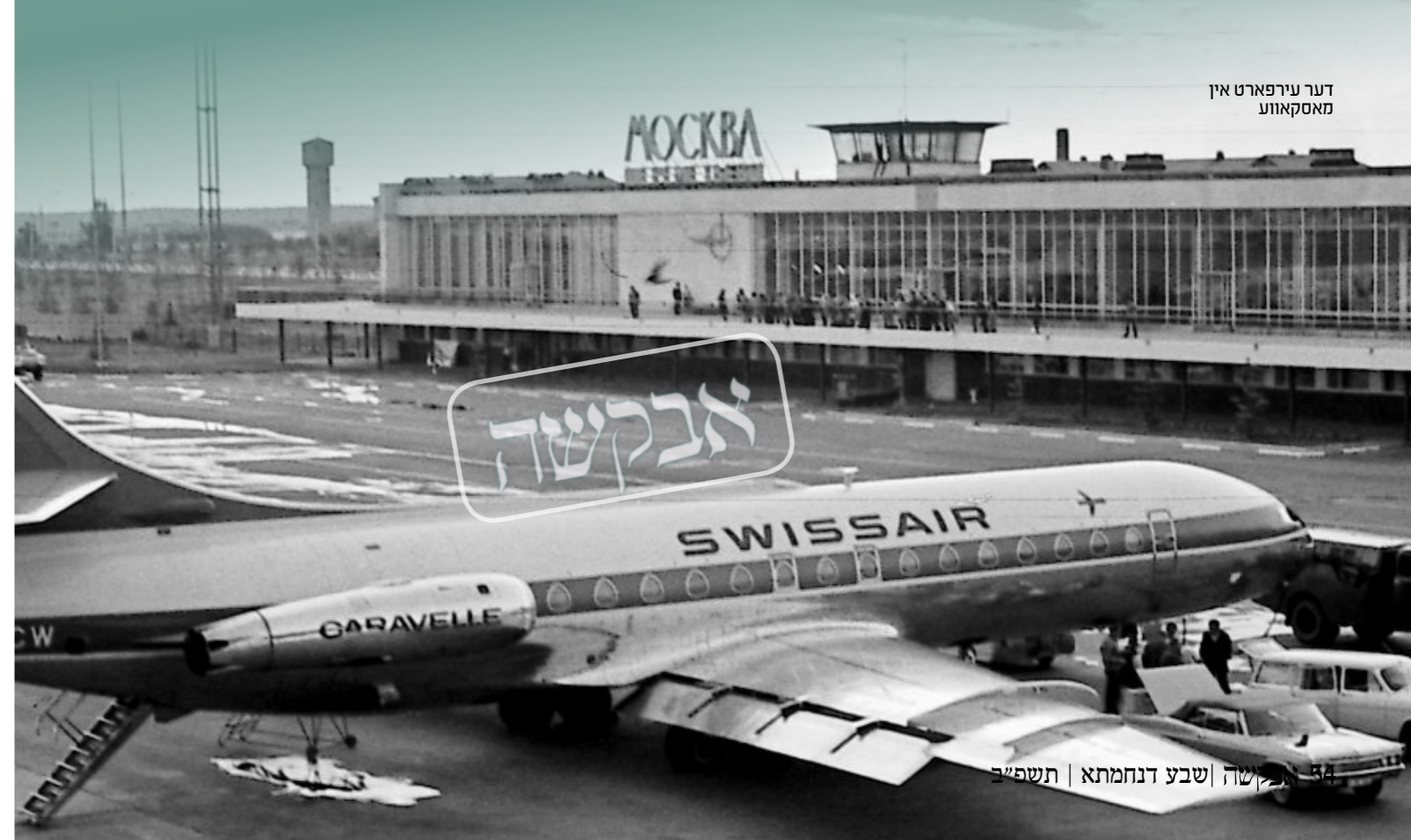
דער עירפארט אין מאסקאווע

"איך וואונטש זיך צו זעהן די לעכטיגקייט פון די וועגן אויף וואס איר פארט אויף זיי צו מיר" (חיי מוהר"ן). די נסיעות פון די ברסלבער חסידים צום ציון הקדוש פון דעם הייליגן רבי'ן איז נישט קיין לערע זאך. אויב איז דאס געווען גילטיג אין דער צייט ווען די ווערטער זענען געזאגט געווארן, איז דאס אין פאקט געווארן פיל-פאכיג מער באדייטנד אין יענע טעג נאך איידער עס האט זיך געשפאלטן דעם אייזערנעם פארהאנג וואס האט פונאדערגעשיידט צווישן די הערצער פון די ברסלבער חסידים אין דער גאנצער וועלט, צום ציון הקדוש וואס האט זיך געפונען אזוי ווייט ווי נאר סיי ווען.