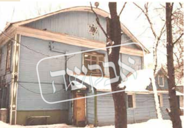
דער בית הכנסת מארינא ראשצע ווי עס האט אויסגעקוקט אין יענע טעג

שוין אין לופטפעלד האבן זיך אנגעהויבן די מניעות ווען אנשטאט זיי צו פאררעדענען וואו צו ווארטן אויפן פליגער, האט מען זיי אנגעהויבן ארומצושלעפן פון דא צו דארט, אהין און אהער. אין יענער צייט, איידער עס האט נאך עקזעסטרירט די עלעקטעראנישע שילדן מיט אלע אינפארמאציע אויף יעדן פליגער, האט די חבורה זיך געמוזט ארומדרייען א לאנגע שעה אין דעם לאנג שטרעקיקן