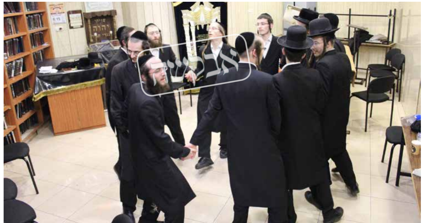
בני החבורה חיקונו כל הזמן. בני החבורה בריקוד עליו