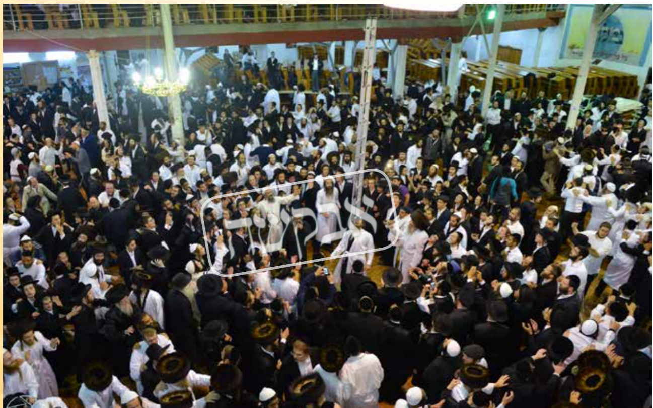
החלום הנכסף להגיע לציון בר"ה. ריקודי השמחה פורצים על השמחה שזכינו להיות בקיבוץ של הרב'ה

רואים בפירוש מוהרנ"ת שכל מטרת הנסיעה היא להפוך לאיש כשר, כמו שמספר לבנו שנוסע לציוה"ק, "אולי הפעם" יעזור לו הש"י וכבר ייעשה איש כשר וכו'. דומה שנדרש תיקון גדול בדבר בסיסי ויסודי זה. אם ברצונך להביא רבים לאומן, ולשם כך הנך מוכר את התפילין! שב ואל תעשה עדיף, הנח לו לרבינו שידאג לקרב אליו את נשמות ישראל, ולא זו אף זו שבוודאי שאף לכל צרכיהם הגשמיים ידאג רבינו על הצד היותר טוב, וכמו שאמר בפי' 'שהתבונן כבר על הוצאות הדרך בהליכה ובחזרה', והוא ידאג בוודאי גם לכל אחד שימצא מקום להניח עליו את ראשו, וכן מקום לסעוד בו סעודת יו"ט... וע"ד שאמר מוהרנ"ת ארץ פסח וועט זיין, ווי נעמט מען דעם פסח אליין? (צרכי הפסח יהיה, אך כיצד לוקחים את הפסח בעצמו?) כלומר, אל תדמה בנפשך שזהו העיקר, גם אם בוודאי ראוי לנו שיהיו מצויים כל צרכי הפסח בהרחבה... ובפירוש אמר רביז"ל כי ר"ה גדול כ"כ עד שכבר אין נפק"מ "יא עסין נישט עסן, יא שלאפן נישט שלאפן" (אם לאכול אם שלא לאכול, אם לישון אם שלא לישון) וכו' וכפי שמציין המעתיק מיד, שכ"ז הוא בבחינת "לא דיברה תורה אלא כנגד יצה"ר"